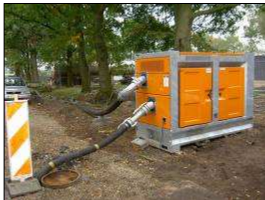
na przyczepie do szybkiego holowania

automatyczny sterownik start-stop agregat zabudowany na 4-kołowej z dwoma włącznikami pływakowymi auto-O-manual, z licznikiem godzin pracy